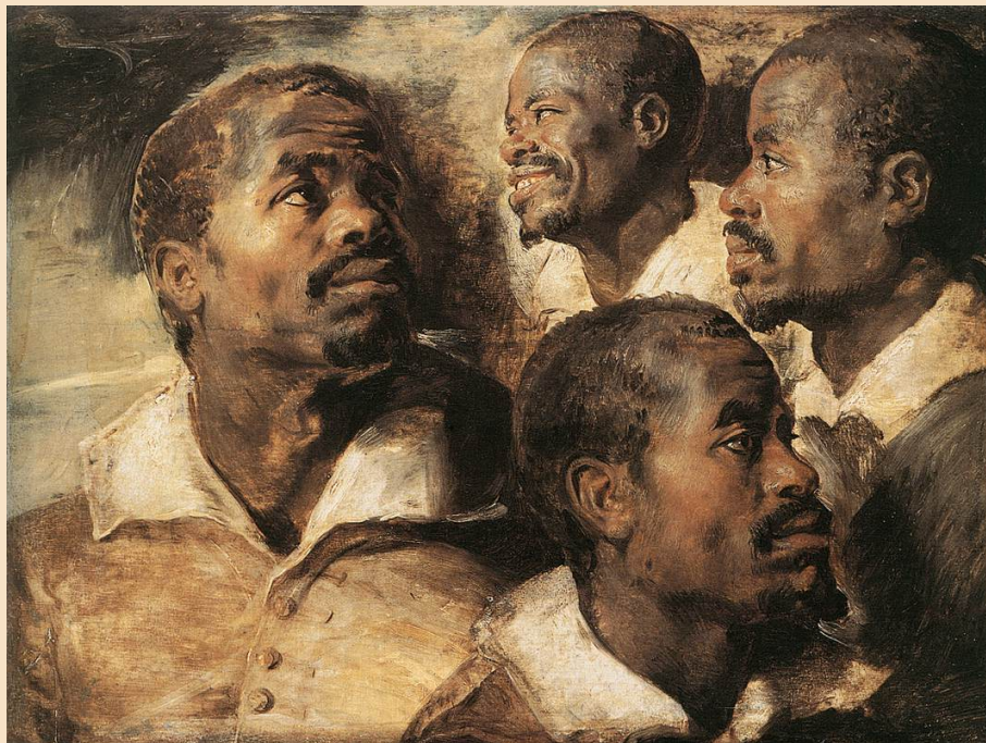
Pieter Paul Rubens, Quattro studi , 1617